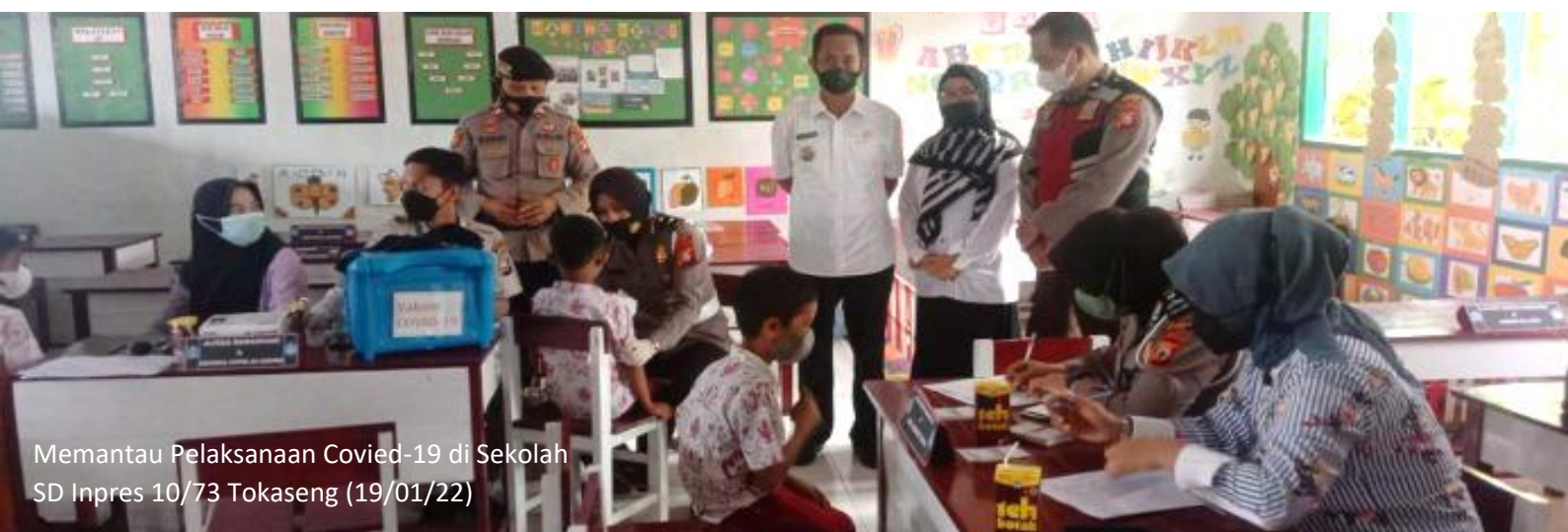
Memantau Pelaksanaan Covid-19 di Sekolah SD Inpres 10/73 Tokaseng (19/01/22)

Sumber Data : Renstra Perubahan Kecamatan Tellu Siattinge 2018-2023