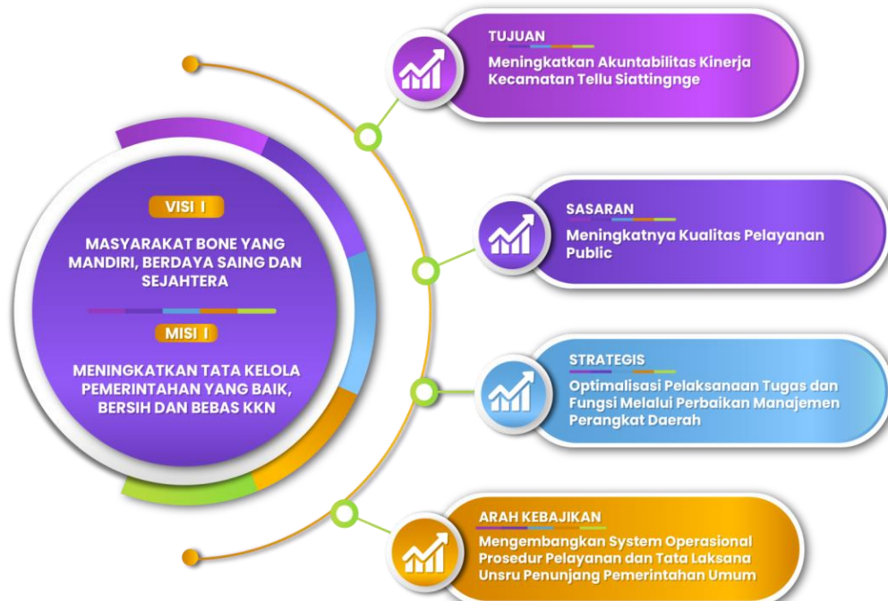
Gambar 2.1 Tujuan, sasaran, strategi dan arah kebijakan Kecamatan Tellu Siattinge