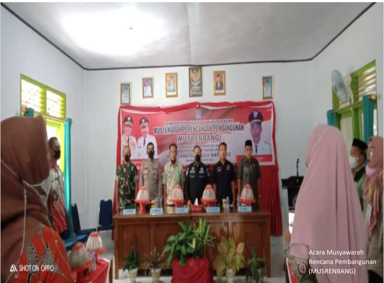
Acara Musyawarah Rencana Pembangunan (MUSRENBANG)