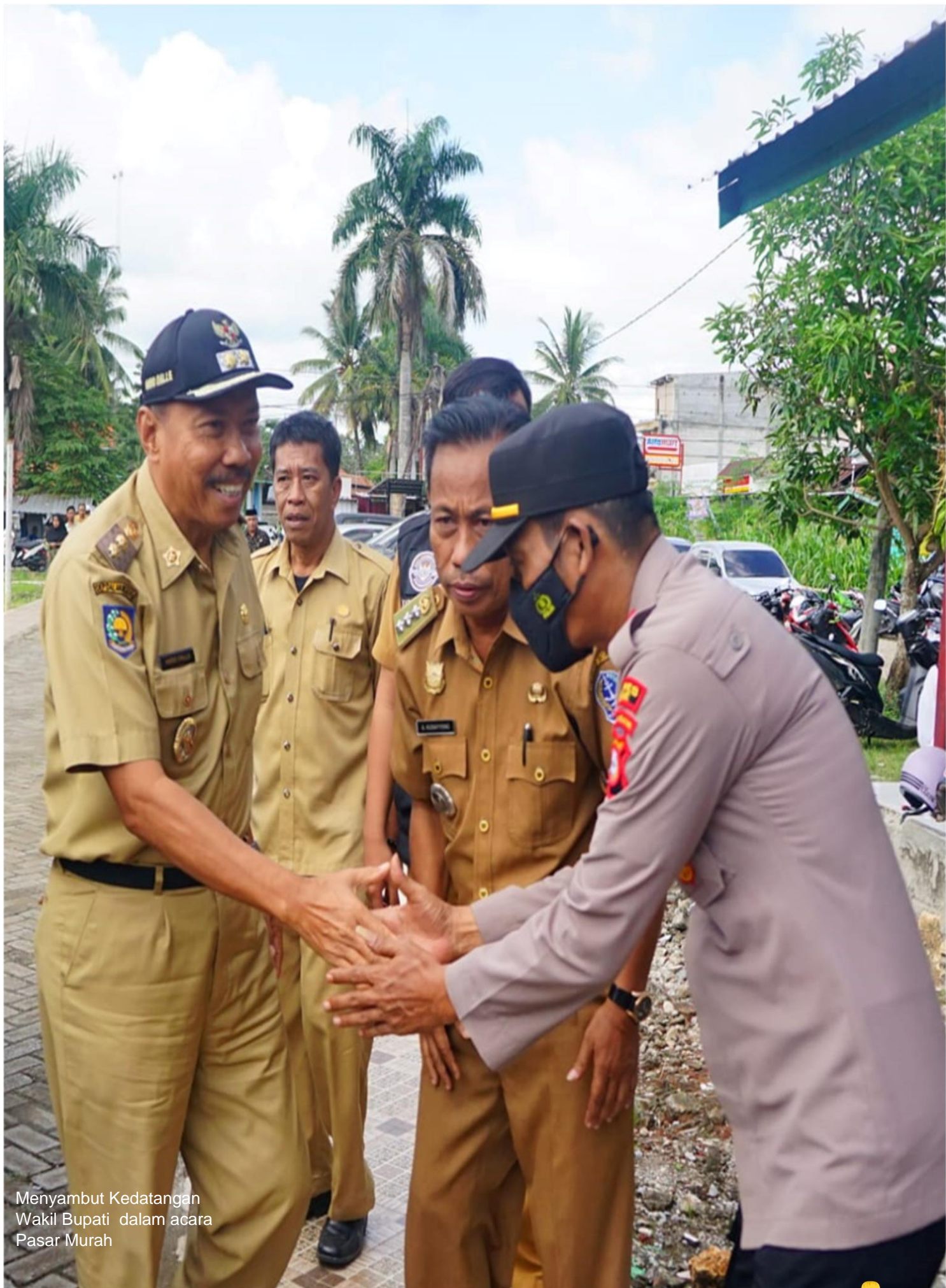
Menyambut Kedatangan Wakil Bupati dalam acara Pasar Murah