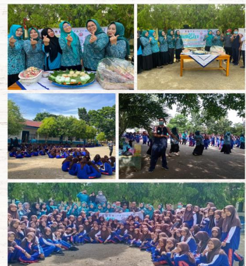
Lokus SMPN 1 Lamurukung