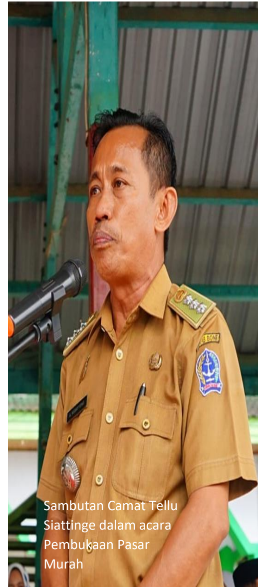
Sambutan Camat Tellu Siattinge dalam acara Pembukaan Pasar Murah