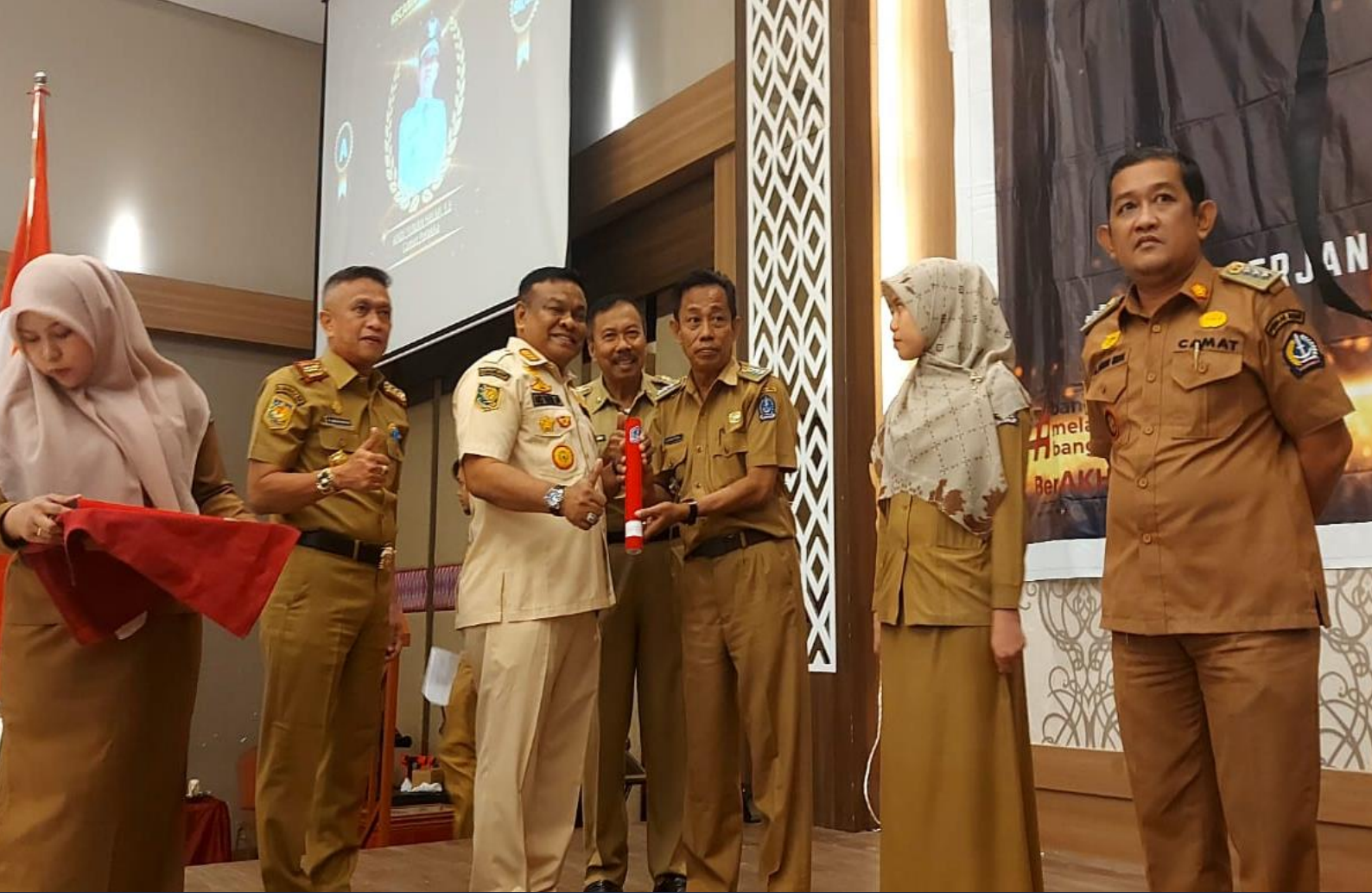
★★★★★ Penandatanganan Perjanjian Kinerja ★★★★★