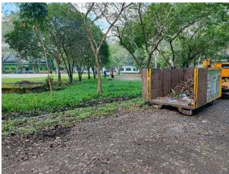
Gambar 3 Pengelolaan Hutan Kota, Islamic Center Kelurahan Biru