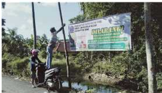
Gambar 2 Pemasangan Papan Informasi di titik Sampah Liar

Pengelolaan persampahan yang masih saja menjadi isu utama dalam urusan lingkungan Hidup tentu saja menjadi perhatian yang besar bagi Dinas Lingkungan Hidup.