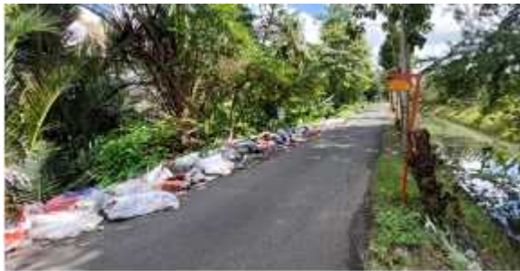
Gambar 1 Titik sampah liar di Jalan Kinabalu Kelurahan Macanang

Permasalahan yang teridentifikasi pada triwulan pertama urusan lingkungan hidup, adalah: