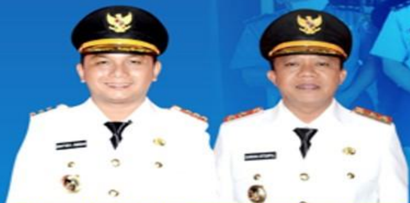
BAKHTIAR AHMAD SIBARANI BUPATI TAPANULI TENGAH

UPDATE DATA PASIEN PADA TANGGAL 4 MEI 2020