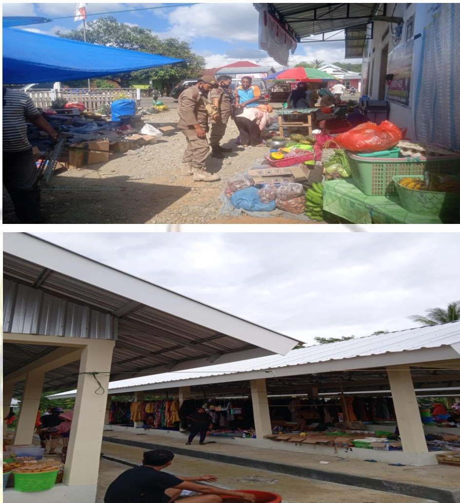
Gambar 5 Kegiatan Pengawasan Retribusi Pasar