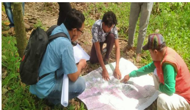
Pemutakhiran Data PBB-P2