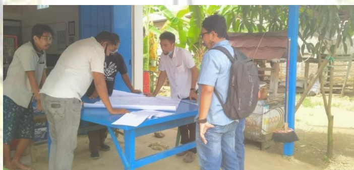
Pengelolaan Pajak Bumi dan Bangunan