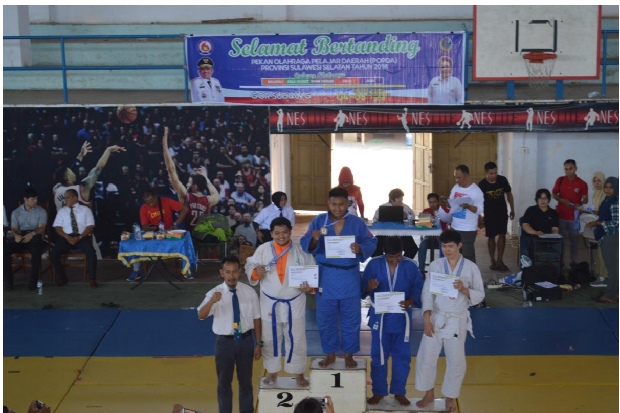
Penerimaan Medali Cabang Olahraga Judo POPDA tahun 2018