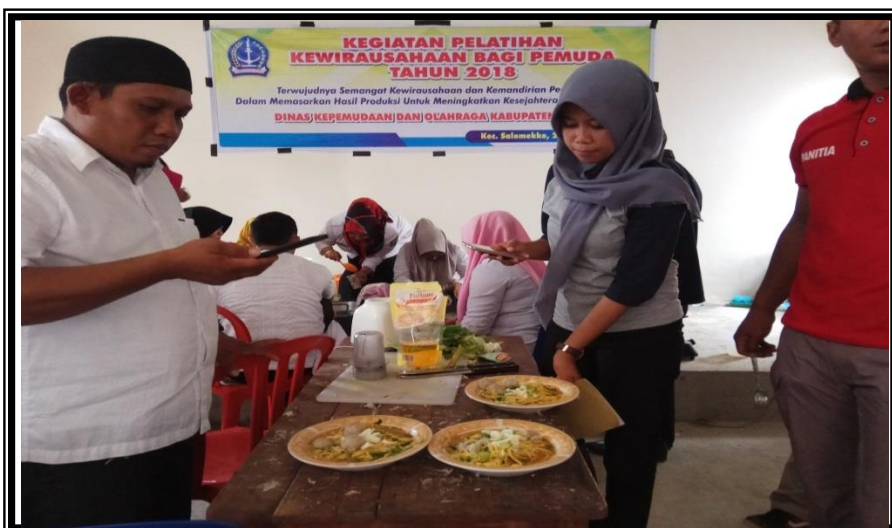
Peserta Menyajikan Mie Kuah dan Bakso Hasil Bimbingan Pemateri Kegiatan Pelatihan Kewirausaan Bagi Pemuda Kelurahan Pancaitana Kecamatan Salomekko Rabu 29 Agustus 2018