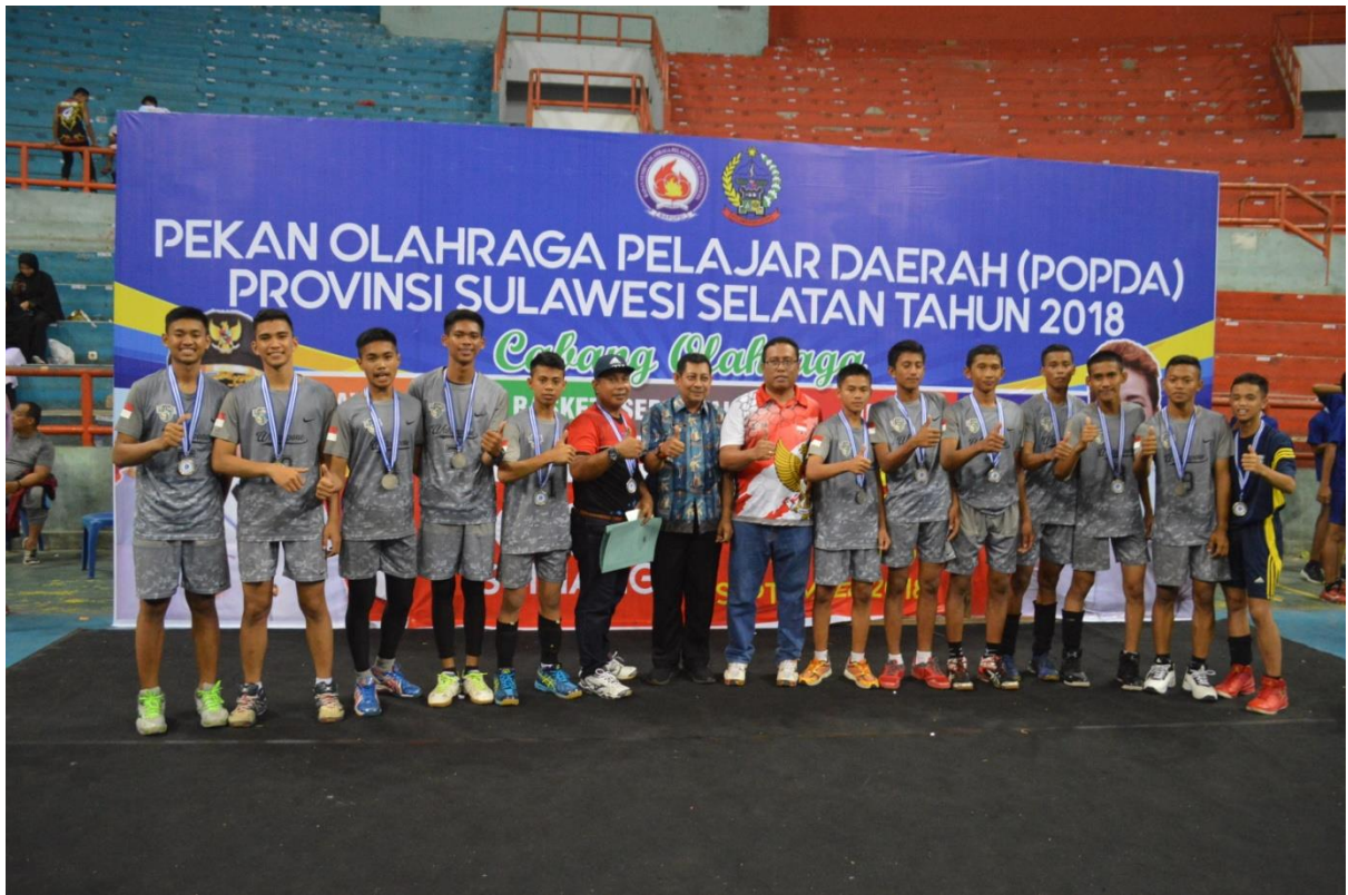
Penerimaan Medali Tim Bola Voly POPDA Tahun 2018