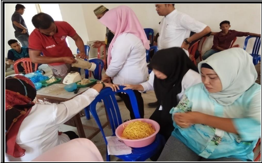
Peserta Praktek Langsung Pembuatan Bakso Ikan dan Mi Kuah Kegiatan Pelatihan Kewirausaan Bagi Pemuda Kelurahan Pancaitana Kecamatan Salomekko Rabu 29 Agustus 2018