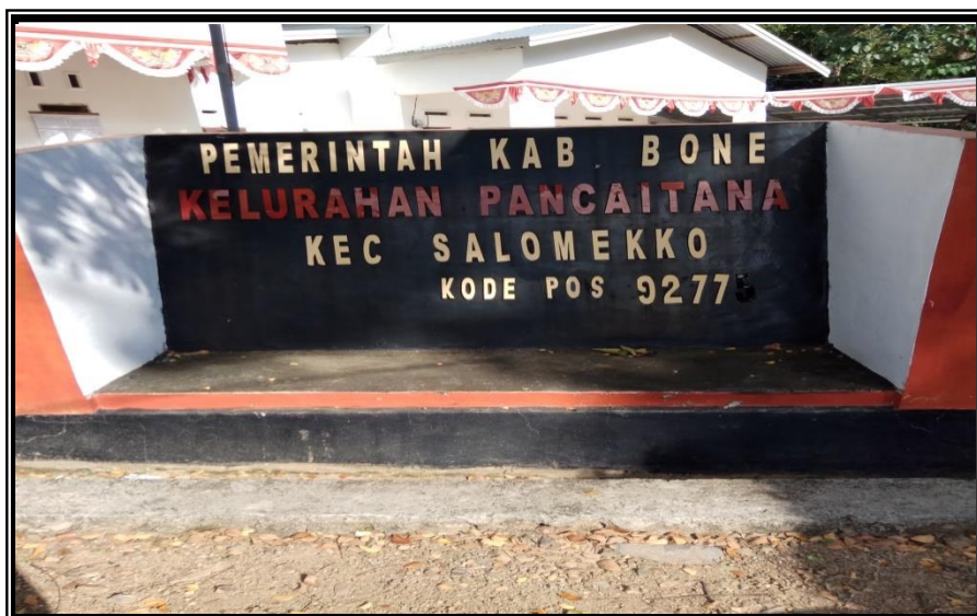
Lokasi Pelatihan Kewirausaan Bagi Pemuda Kelurahan Pancaitana Kecamatan Salomekko Rabu 29-30 Agustus 2018

Alamat : Stadion La Patau Telp. (0481) 26678 Watampone