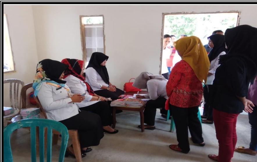
Registrasi Peserta Kegiatan Pelatihan Kewirausahaan Bagi Pemuda Kelurahan Pancaitana Kecamatan Salomekko Rabu 29 Agustus 2018