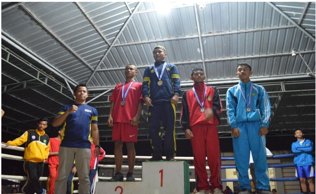
Penerimaan Medali Cabang Olahraga Tinju POPDA tahun 2018