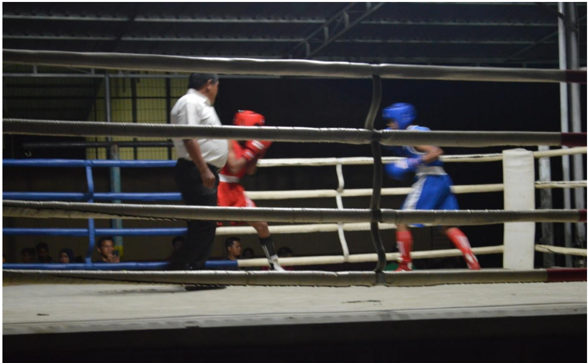
Pelaksanaan Pertandingan Tinju POPDA tahun 2018