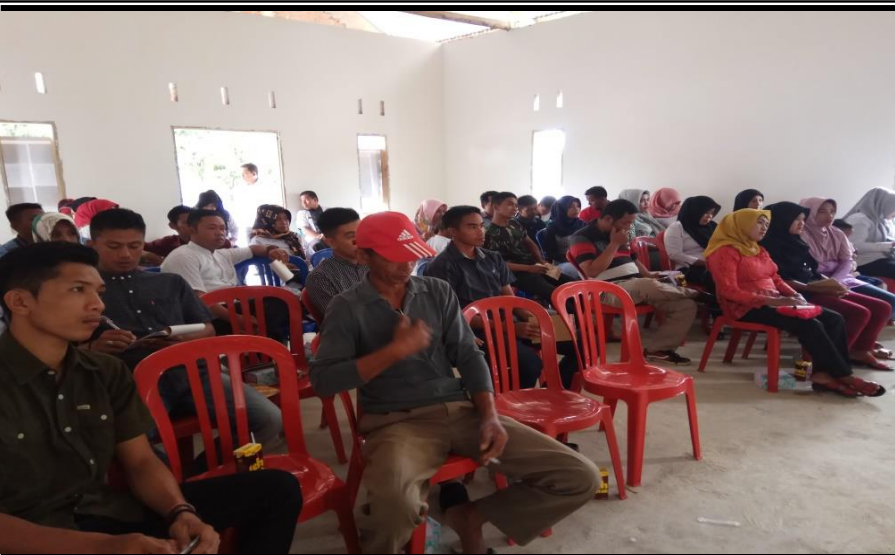
Peserta Kegiatan Pelatihan Kewirausaan Bagi Pemuda Kelurahan Pancaitana Kecamatan Salomekko Rabu 29 Agustus 2018