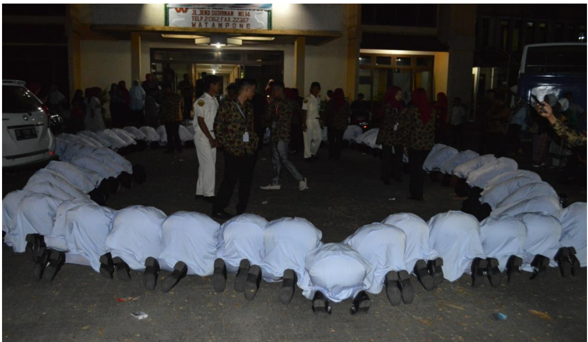
Foto Silaturahmi Dengan Pj. Bupati Bone dan Syukuran Purna PASKIBRAKA TAHUN 2018