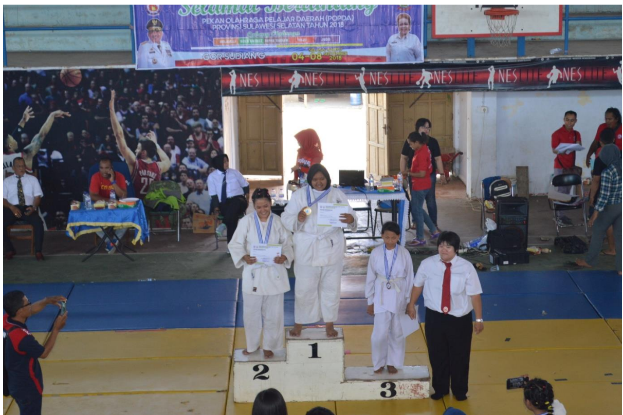
Penerimaan Medali Cabang Olahraga Judo POPDA tahun 2018