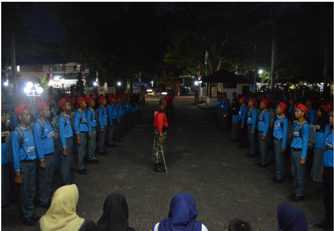
Foto Latihan Peserta PASKIBRAKA Tahun 2018