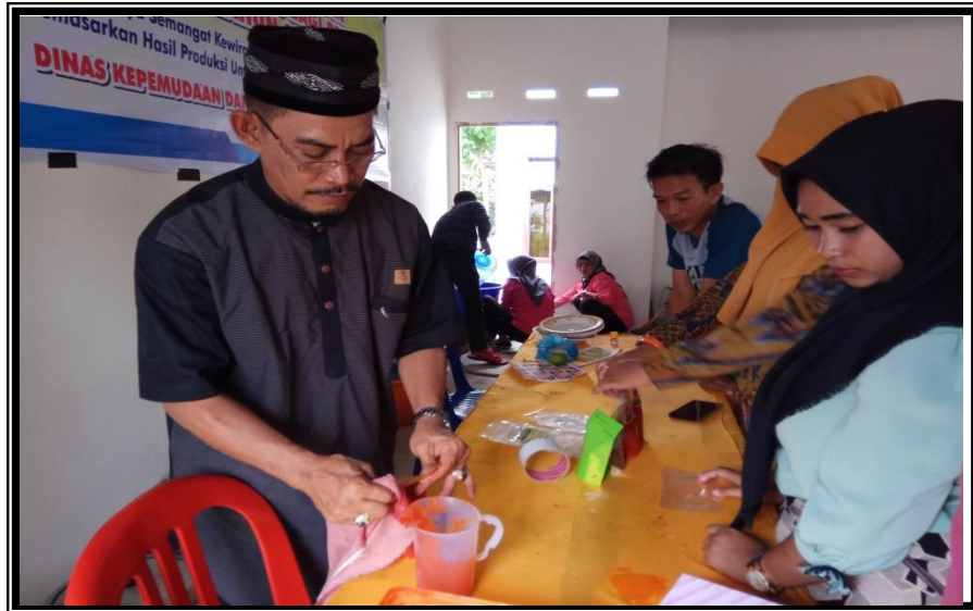
Narasumber mengarahkan Peserta Praktek Pembuatan Saos Pepaya Kegiatan Pelatihan Kewirausahaan Bagi Pemuda Kelurahan Pancaitana Kecamatan Salomekko Kamis 30 Agustus 2018