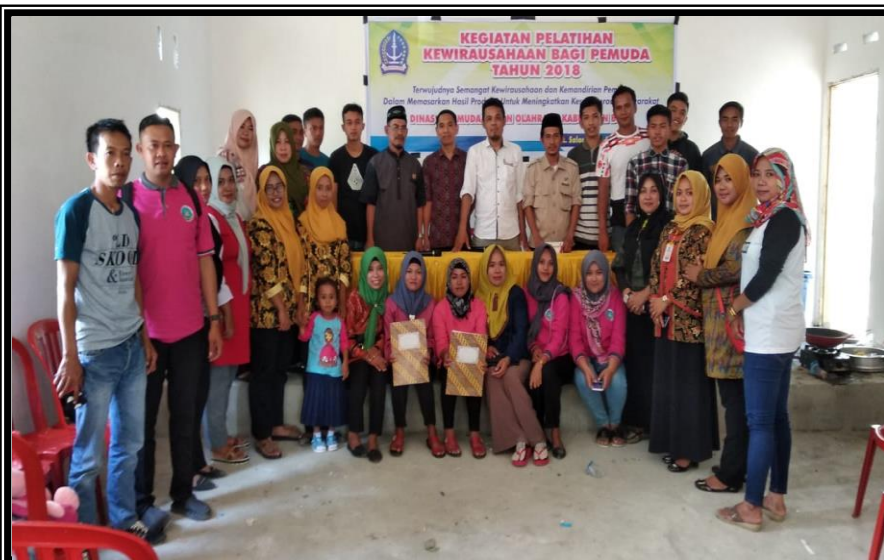
Panitia, Moderator, Narasumber dan Peserta Penutupan Kegiatan Pelatihan Kewirausaan Bagi Pemuda Kelurahan Pancaitana Kecamatan Salomekko Kamis 30 Agustus 2018