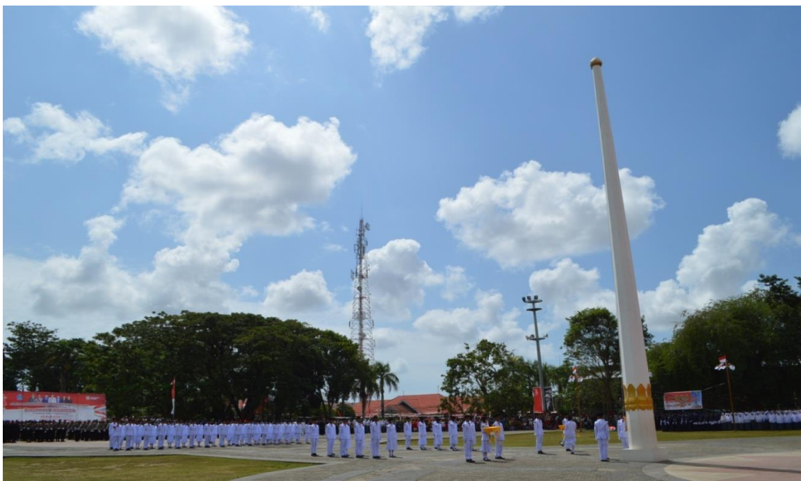
Foto Pengibaran Sang Merah Putih HUT Proklamasi Kemerdekaan RI Tahun 2018