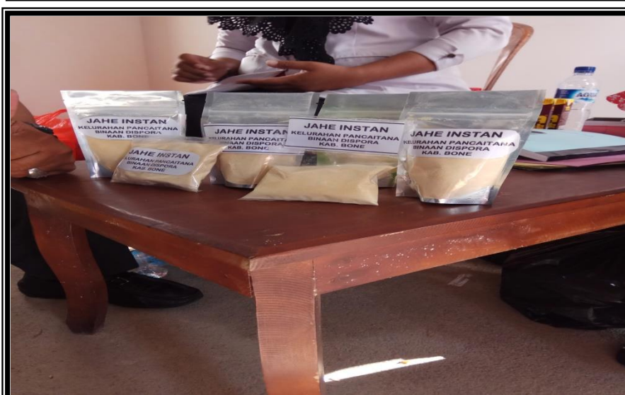
Hasil pembuatan jahe instan yang sudah dikemas dan diberi lebel Kegiatan Pelatihan Kewirausahaan Bagi Pemuda Kelurahan Pancaitana Kecamatan Salomekko Rabu 29 Agustus 2018