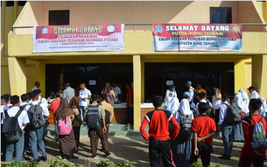
Foto Pendaftaran Peserta Seleksi Calon PASKIBRAKA Tahun 2018