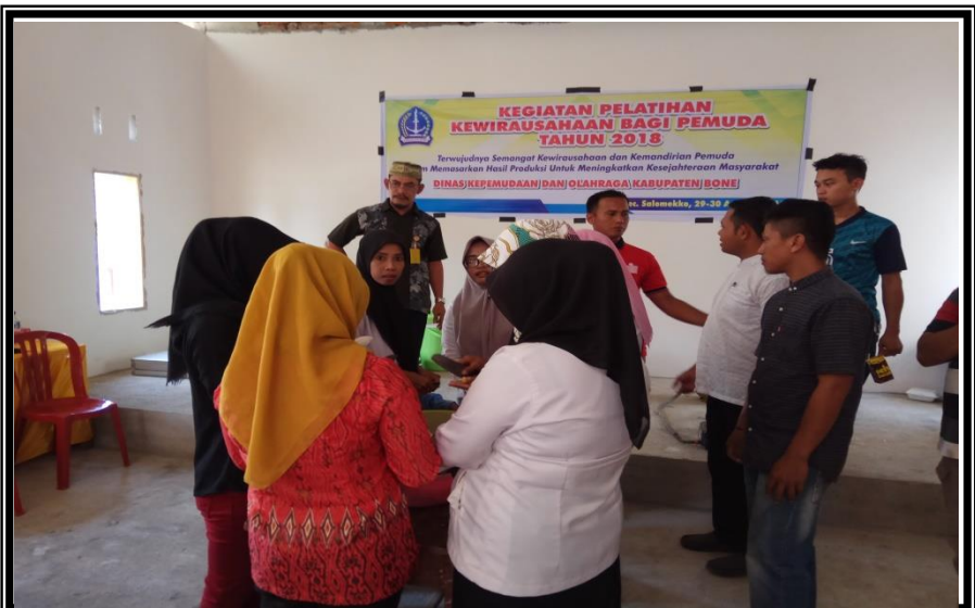
Narasumber membentuk Kelompok Praktek Pembuatan Jahe Instan Kegiatan Pelatihan Kewirausaan Bagi Pemuda Kelurahan Pancaitana Kecamatan Salomekko Rabu 29 Agustus 2018