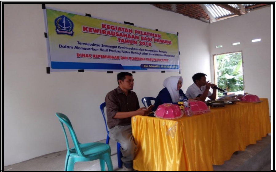
Peserta Menerima Materi dari Narasumber Kegiatan Kegiatan Pelatihan Kewirausaan Bagi Pemuda Kelurahan Pancaitana Kecamatan Salomekko Rabu 29 Agustus 2018