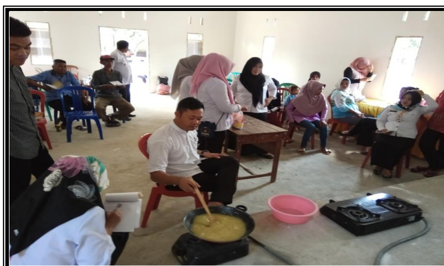
Peserta Praktek Langsung Pembuatan Jahe Instan Kegiatan Pelatihan Kewirausahaan Bagi Pemuda Kelurahan Pancaitana Kecamatan Salomekko Rabu 29 Agustus 2018