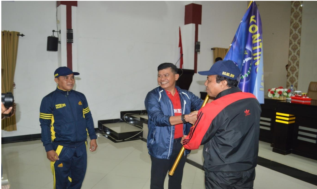
Penyerahan Bendera kontingen Pekan Olahraga Pelajar Daerah (POPDA) 2018 Oleh Bapak Pj. Bupati Bone Kepada Ketua Kontingen (Kepala Dinas Kepemudaan dan Olahraga Kabupaten Bone)