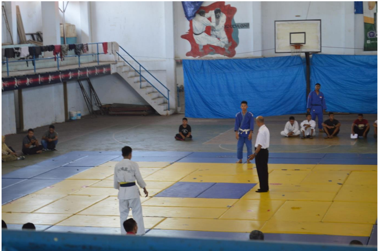
Pelaksanaan Pertandingan Bela Diri Judo POPDA Tahun 2018