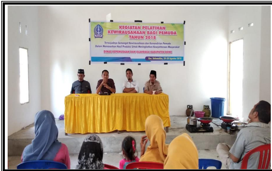
Kasubid Peningkatan Iptek dan Imtaq Pemuda Dispora Kab. Bone Menutup Kegiatan Pelatihan Kewirausaan Bagi Pemuda Kelurahan Pancaitana Kecamatan Salomekko Kamis 30 Agustus 2018