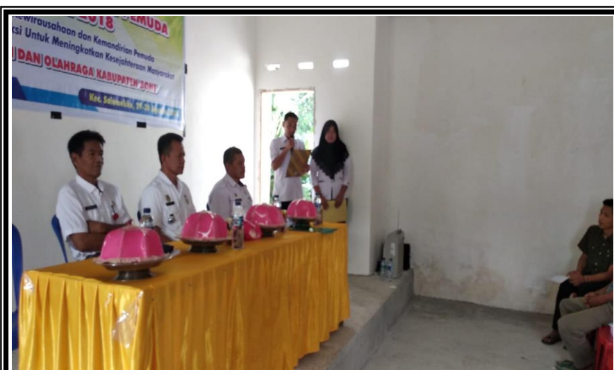
Laporan Ketua Panitia Kegiatan Pelatihan Kewirausahaan Bagi Pemuda Kelurahan Pancaitana Kecamatan Salomekko Rabu 29 Agustus 2018