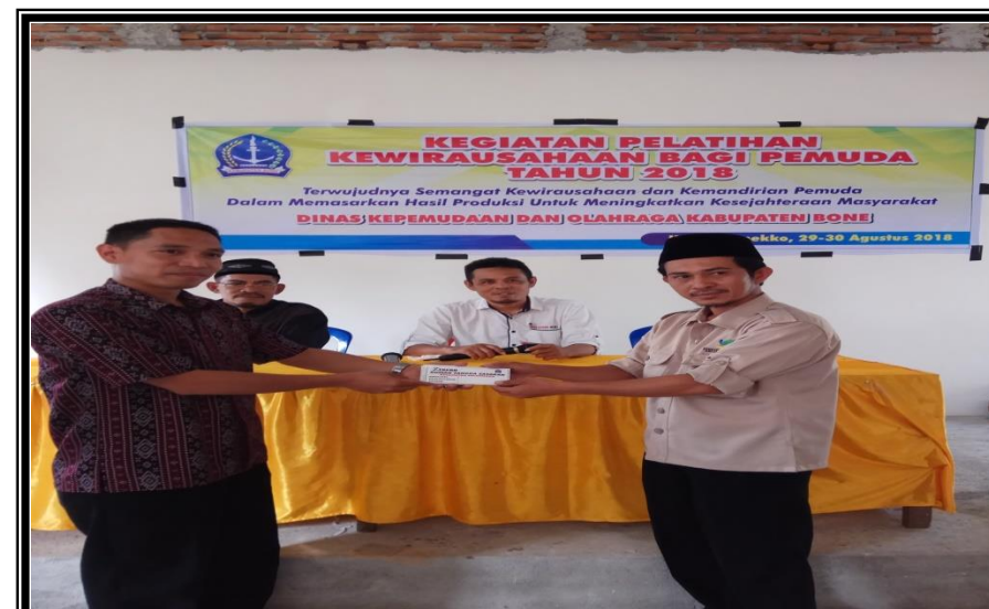
Penyerahan Stiker RTH Secara Symbolis kepada TKSK Kec. Salomekko Kegiatan Pelatihan Kewirausahaan Bagi Pemuda Kelurahan Pancaitana Kecamatan Salomekko Kamis 30 Agustus 2018