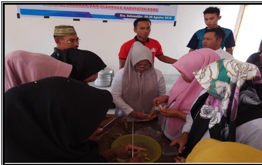
Narasumber mengarahkan Peserta Praktek Pembuatan Jahe Instan Kegiatan Pelatihan Kewirausahaan Bagi Pemuda Kelurahan Pancaitana Kecamatan Salomekko Rabu 29 Agustus 2018