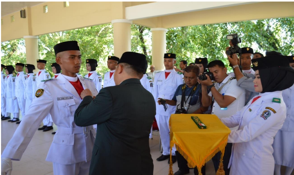
Foto Pengukuhan PASKIBRAKA Tahun 2018