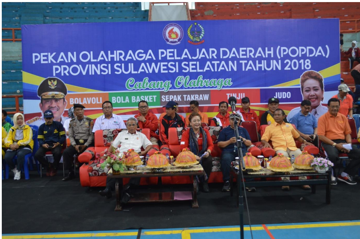
Pembukaan Pekan Olahraga Pelajar Daerah (POPDA) Prov Sulawesi Selatan Tahun 2018