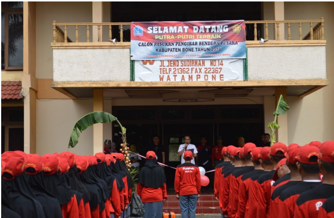
Foto Penerimaan Karantina PASKIBRAKA Tahun 2018