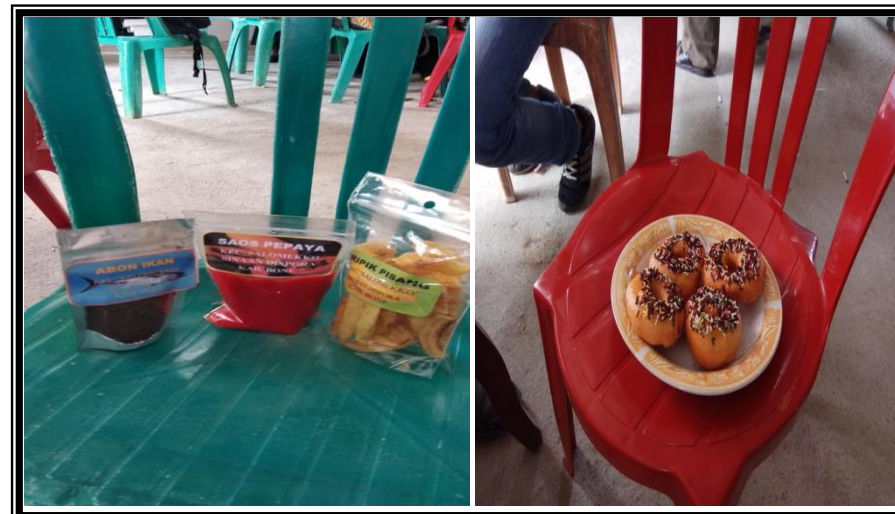
Abon Ikan, Saos Pepaya, Kripik Pisang dan Donat Hasil Buatn Peserta Kegiatan Pelatihan Kewirausahaan Bagi Pemuda Kelurahan Pancaitana Kecamatan Salomekko Kamis 30 Agustus 2018