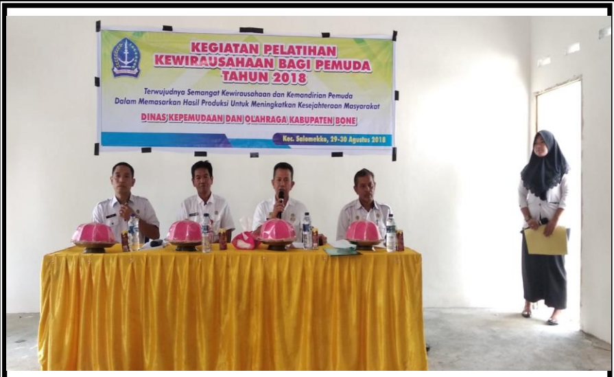
Camat Kecamatan Salomekko Kab. Bone Membuka Kegiatan Pelatihan Kewirausaan Bagi Pemuda Kelurahan Pancaitana Kecamatan Salomekko Rabu 29 Agustus 2018