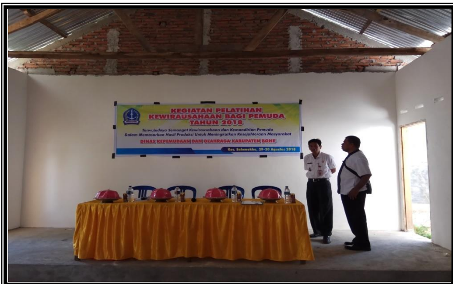
Lokasi Pelatihan Kewirausaan Bagi Pemuda Kelurahan Pancaitana Kecamatan Salomekko Rabu 29-30 Agustus 2018