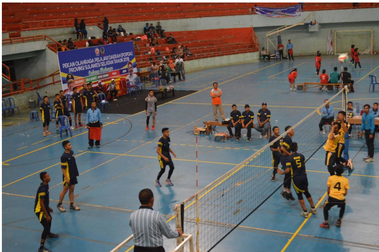
Pelaksanaan pertandingan Bola Voly POPDA tahun 2018