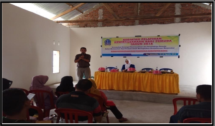
Peserta Menerima Materi dari Narasumber Kegiatan Kegiatan Pelatihan Kewirausaan Bagi Pemuda Kelurahan Pancaitana Kecamatan Salomekko Rabu 29 Agustus 2018