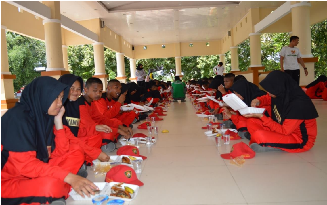
Foto Latihan Peserta PASKIBRAKA Tahun 2018