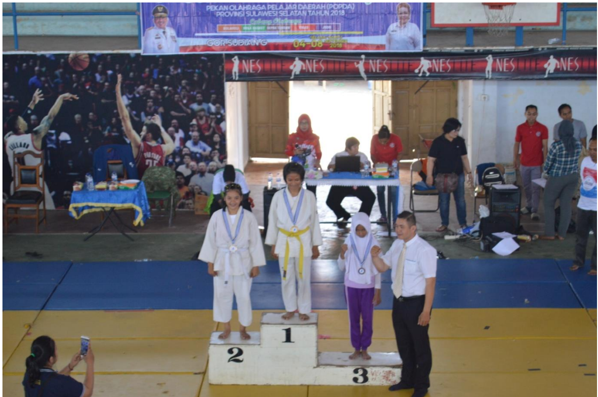
Penerimaan Medali Cabang Olahraga Judo POPDA tahun 2018