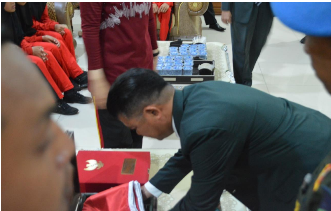
Foto Pemeriksaan Bendera Pusaka Sang Merah Putih Oleh Pj. Bupati Bone dan PASKIBRAKA Tahun 2018