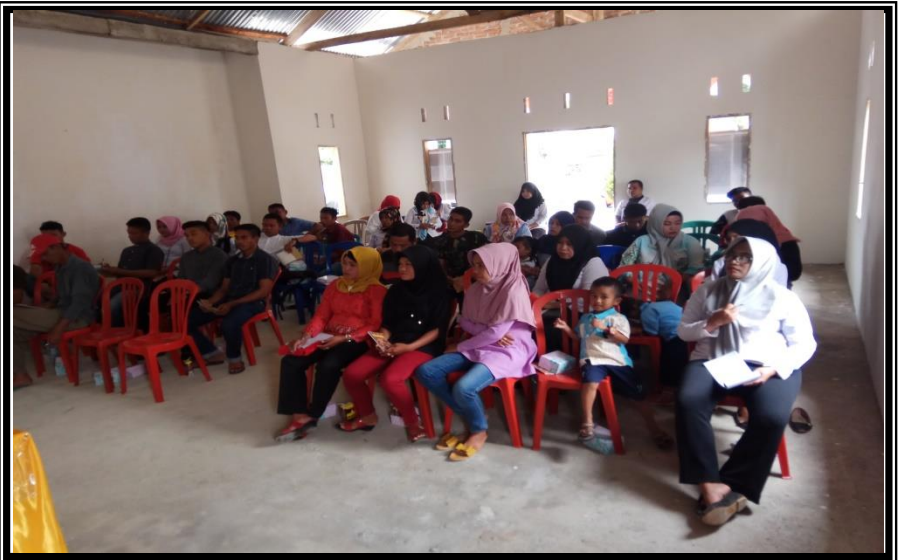
Peserta Kegiatan Pelatihan Kewirausaan Bagi Pemuda Kelurahan Pancaitana Kecamatan Salomekko Rabu 29 Agustus 2018