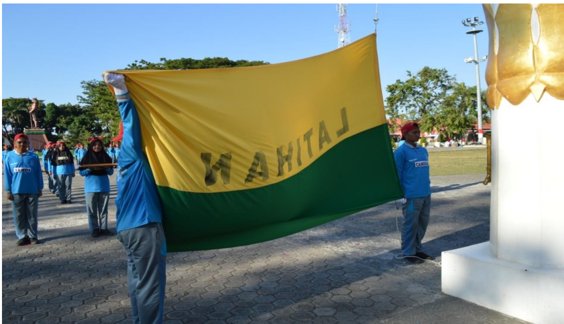
Foto Latihan Peserta PASKIBRAKA Tahun 2018