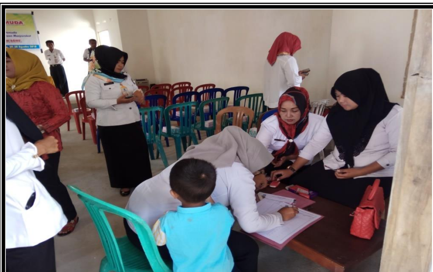
Registrasi Peserta Kegiatan Pelatihan Kewirausahaan Bagi Pemuda Kelurahan Pancaitana Kecamatan Salomekko Rabu 29 Agustus 2018