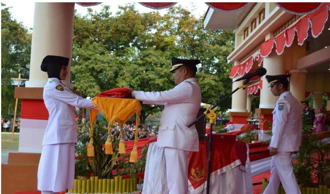
Foto Penurunan Sang Merah Putih HUT Proklamasi Kemerdekaan RI Tahun 2018