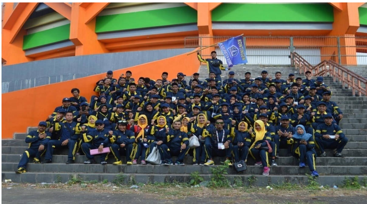
Rombongan Kontingen POPDA Kabupaten Bone Tahun 2018