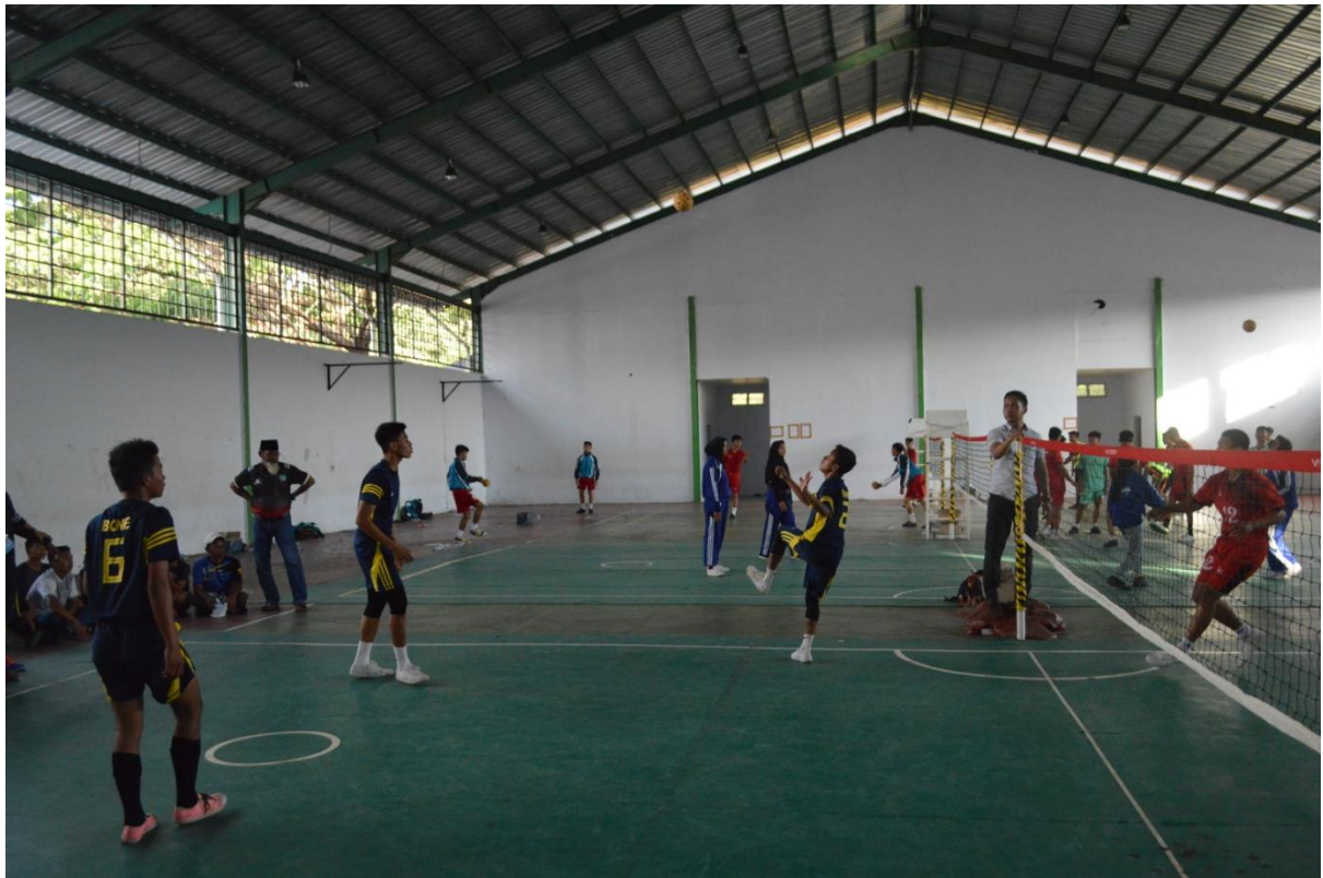
Pelaksanaan Pertandingan Sepak Takraw POPDA tahun 2018