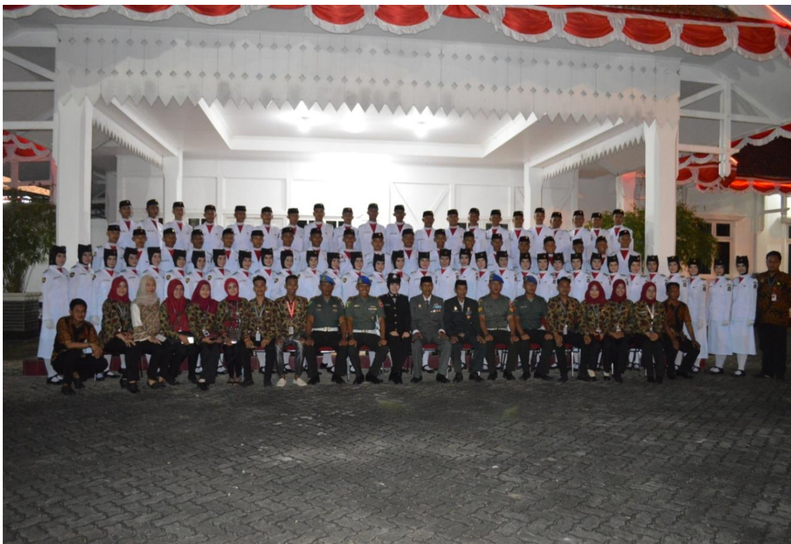
Foto Bersama Setelah Pelaksanaan Pengibaran dan Penurunan Bendera Pada Peringatan HUT Proklamasi Kemerdekaan Republik Indonesia Tahun 2018