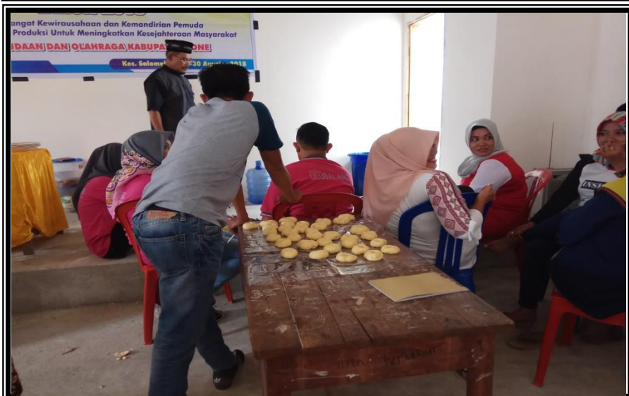
Peserta Praktek Langsung Pembuatan Donat dan Abon Ikan Kegiatan Pelatihan Kewirausaan Bagi Pemuda Kelurahan Pancaitana Kecamatan Salomekko Rabu 30 Agustus 2018