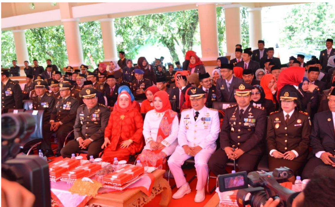
Foto Detik-Detik Peringatan HUT Republik Indonesia Tahun 2018