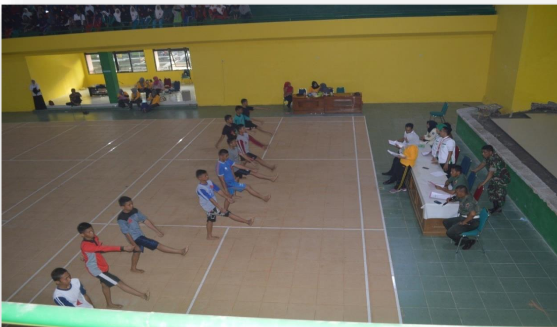
Foto Seleksi Calon PASKIBRAKA Tahun 2018